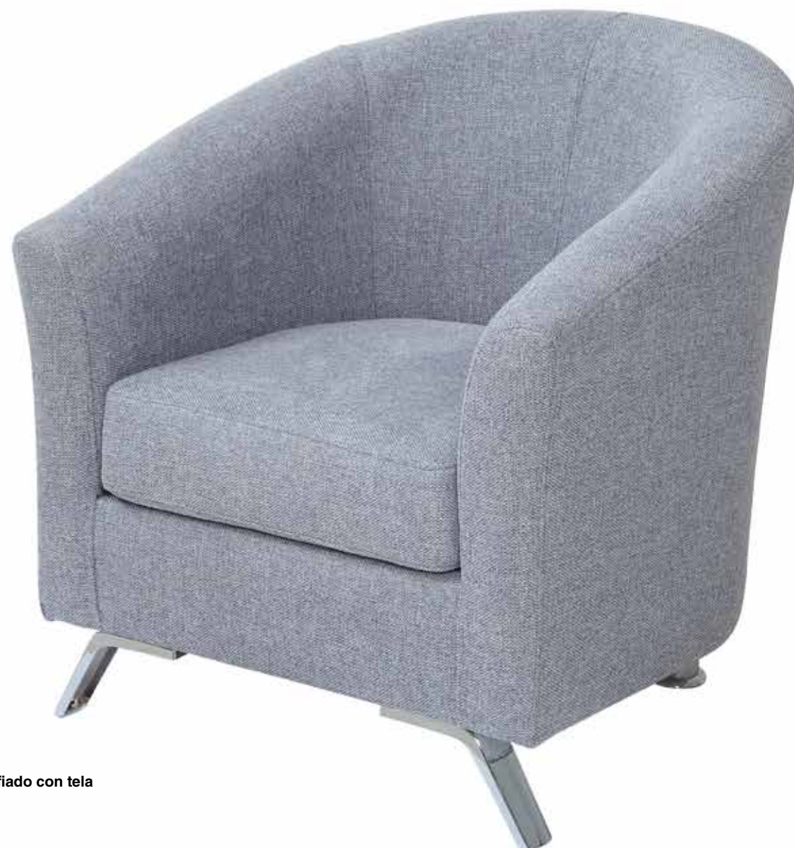
Modelo fotografiado con tela BELA 13